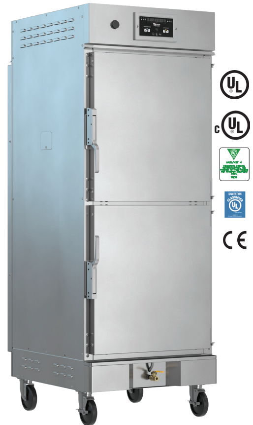
Modelo mostrado: HOV3-14UV

El armario de espera humidificado original sigue siendo el mejor. La tecnología CVap utiliza conjuntamente calor seco y vapor para controlar la temperatura de los alimentos y mantenerlos tan jugosos o crujientes como se desee. Obtenga más información en winstonfoodservice.com .