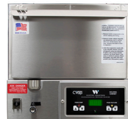
HBB5N1 ТЕПЛОЙ ШКАФ CVAP С СЕКЦИЯМИ Электронное дифференциальное управление