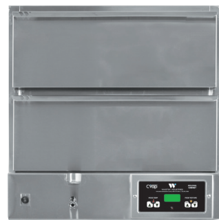
HBB5D2 ТЕПЛОВЫЕ ШКАФЫ CVAP С СЕКЦИЯМИ Электронное дифференциальное управление

МОДЕЛЬ ДВОЙНОГО ШКАФА С ВЕНТИЛЯТОРОМ (ПОКАЗАНА)