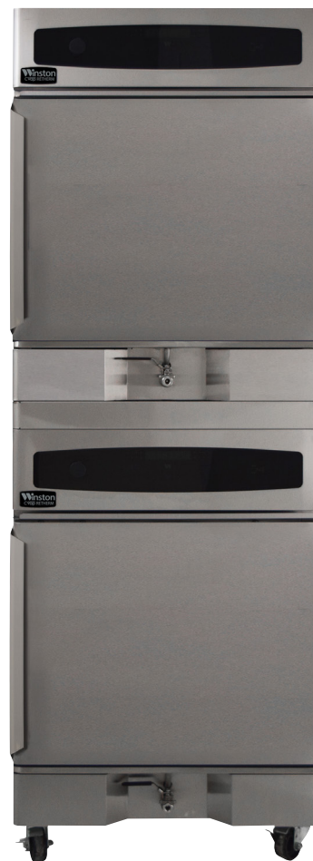
Przedstawiony model: RTV5-05UV w konfiguracji wieżowej

Piec CVap RTV to najszybszy spośród aktualnie dostępnych pieców CVap. Niektórzy nazywają go „kombiwarem dla ubogich”. My nie chcemy nikogo wprowadzać w błąd... to nie jest kombiwar. Tak, pozwala przyrządzać potrawy z precyzją sous vide, a także piec ciasta i inne potrawy, dusić, gotować czy przyrządzać na parze w niskiej temperaturze... DODATKOWO robi inne rzeczy, o których piec konwekcyjny może tylko pomarzyć. Ale nie upiecze 758 kurczaków w 4 minuty i 33 sekundy. Nie spłaci również hipoteki ani nie pokryje kosztów napraw. Przemawia za nami mnóstwo ciekawostek i danych naukowych, ale nie ma tu na nie dość miejsca. Aby uzyskać więcej informacji, przejdź na stronę www.winstonfoodservice.com i lepiej zapoznaj się z tematem.