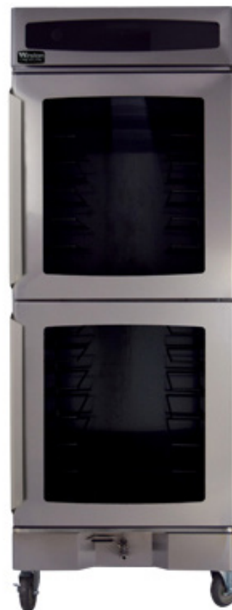
Abgebildetes Modell: HOV7-14UV

Der originale Warmhalteschrank mit Feuchtigkeitssteuerung ist immer noch das Beste. Die CVap-Technologie nutzt trockene Hitze und Wasserdampf, um die Temperatur von Speisen zu kontrollieren und sie so feucht oder knusprig zu halten, wie Sie es wünschen. Erfahren Sie mehr unter winstonfoodservice.com .