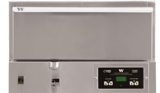
HBB5D1 CVAP WARMHALTE-/ SERVIERSCHRANK Elektronische Temperaturdifferenzregelung

Installationsanforderungen Beim Aufstellen des Geräts muss ein seitlicher Abstand von 2 Zoll (51 mm) eingehalten werden. Das Gerät darf nicht in der Nähe von Wärmequellen aufgestellt werden, welche an der Gehäuseaußenseite Oberflächentemperaturen von über 200 °F verursachen könnten. Spezifische Installationsanforderungen finden Sie im Benutzerhandbuch. Dieses Gerät muss generell nicht unter Abzugshauben vom Typ 1 oder 2 aufgestellt werden. Beachten Sie aber stets die standortspezifischen Anforderungen durch örtliche Gesundheits- und Brandschutzvorschriften.