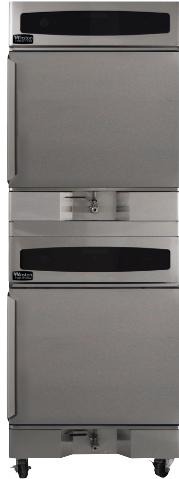
Modèle présenté : RTV5-05UV empilé

Le four de remise en température CVap est le four à cuisson CVap le plus rapide offert actuellement. Des gens le nomme « Le combo de l'homme pauvre ». Nous voulons être honnêtes, ce n'est pas un combo. Oui, il peut cuisiner avec une précision sous vide, ou cuire, ou braiser, ou rôtir, ou pocher, ou cuire à la vapeur à basse température... ET il fait aussi autre chose dont un four à convection ne peut que rêver. Mais, il ne pourra pas rôtir 758 poulets en 4 minutes, 33 secondes. Il ne va pas non plus vous obliger à refinancer votre maison pour en acheter un ou à payer des réparations. Nous sommes fortement appuyés par la science, mais l'espace est restreint ici. Si vous voulez en connaître davantage, visitez notre site Web au www.winstonfoodservice.com , et venez vous amuser avec nous.