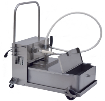
F662T FILTRO DE GRASA PARA COCINAR TRANSPORTABLE

Capacidad La capacidad del tanque es de 41 kg. Sistema eléctrico Se entrega con un cable de alimentación de 152 mm y un enchufe. Plomería Ninguna. Materiales Acero inoxidable de calibre 16-20.