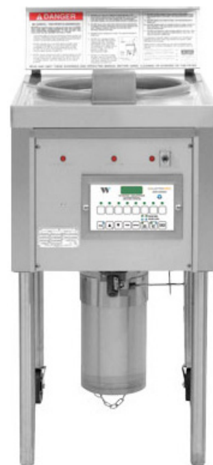
OF49C i OF59C Otwarta frytkownica Collectramatic® 8-kanałowe sterowanie z funkcją programowania

Wymagania montażowe Wymagana wentylacja. Należy przestrzegać przepisów lokalnych.