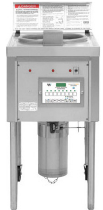
OF49C UND OF59C Collectramatic® Offene Fritteuse Steuerung mit 8 einstellbaren Programmen