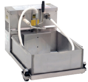
F662A9 FILTRE À SHORTENING

L'acier inoxydable est de calibre 16 à 20.